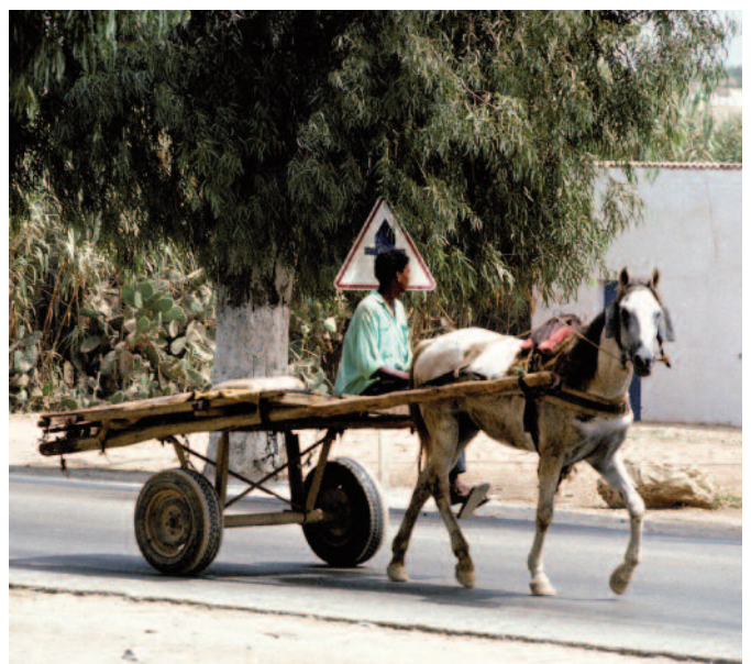
Kleine transportondernemer in Algerije.