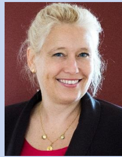
Mevrouw H.W.L.A. de Lange Lid sinds 1 maart 2016